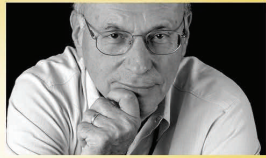
Boris Cyrulnik Invitado Especial

Durante tres días, del 25 al 27 de Mayo de 2017 , se presentará en Bilbao los hallazgos más recientes sobre la VFP. En su exposición intervendrán relevantes ponentes a nivel nacional e internacional así como profesionales especializados que expondrán de manera práctica los avances sobre VFP estructuradas en torno a las 4 líneas bajo las cuales se ha planteado el Congreso: